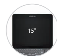
15 Zoll Vollbild-Design

Das integrierte Konzept mit internem Adapter und Akku macht das Z60 Pro mobil und jederzeit und überall einsatzbereit. In Kombination mit 3 Schallkopfanschlüssen erfüllt das Z60 Pro alle Ihre klinischen Anforderungen.