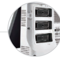
Max 3 Schallkopfanschlüsse