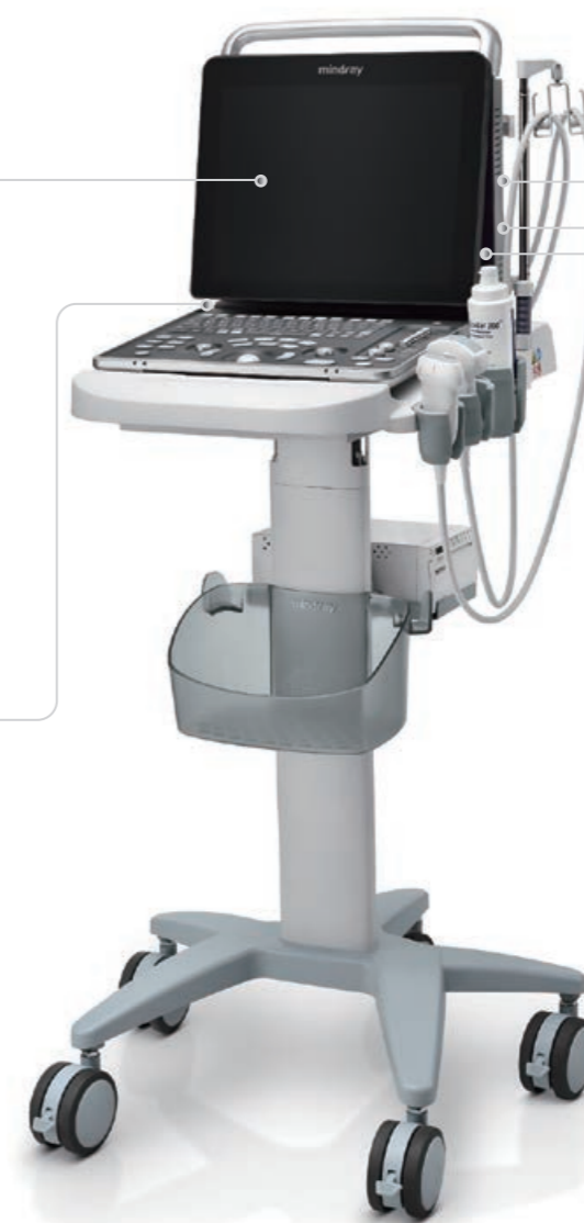
90min Scannen mit wiederaufladbarem Akku