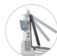
60 Grad Neigungswinkel